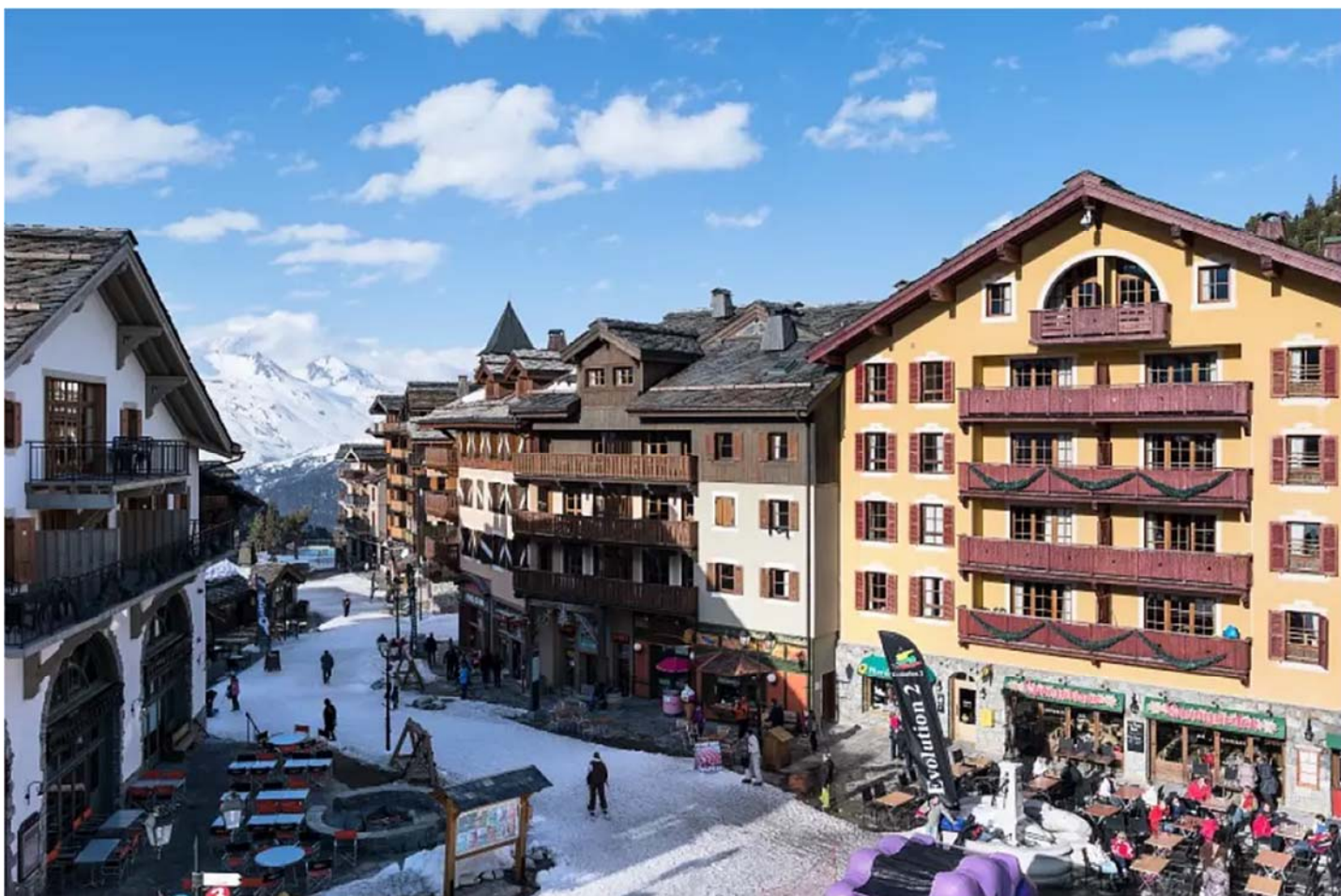
Pildid ja skeemid ei ole lepingulised